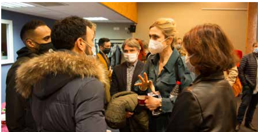
Julie Gayet à la rencontre des acteurs culturels (ici la Cie Pyramid) du territoire au lycée Merleau-Ponty

« Rochefort a deux ambassadeurs : L'Hermione et... les Demoiselles ! À travers ces rencontres, Rochefort inscrit dans le marbre son histoire avec le cinéma et la musique. Une histoire qui a commencé avec Jacques Demy et Michel Legrand lors du tournage des Demoiselles de Rochefort . Si vous nous avez choisi c'est parce que, dans notre ville, tous les acteurs sont légitimes. Aujourd'hui, à Rochefort, comme sur tout le territoire Rochefort Océan, un enjeu autour du cinéma existe indéniablement ».