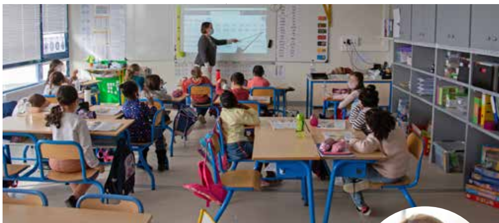
Des classes élémentaires largement ensoleillées

L es travaux se poursuivent dans la partie « école maternelle » du groupe scolaire La Galissonnière. Les classes élémentaires viennent de réintégrer le bâtiment au lendemain des vacances de février, tout comme l'Accompagnement scolaire. Ce sont des espaces entièrement rinnovés, du sol au plafond par la Ville de Rochefort, qu'ont retrouvé les 108 élèves, du CP au CM2. Deux extensions ont été ajoutées