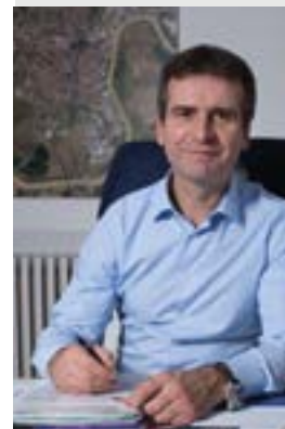
par Hervé BLANCHÉ

Maire de Rochefort Président de la Communauté d'agglomération Rochefort Océan