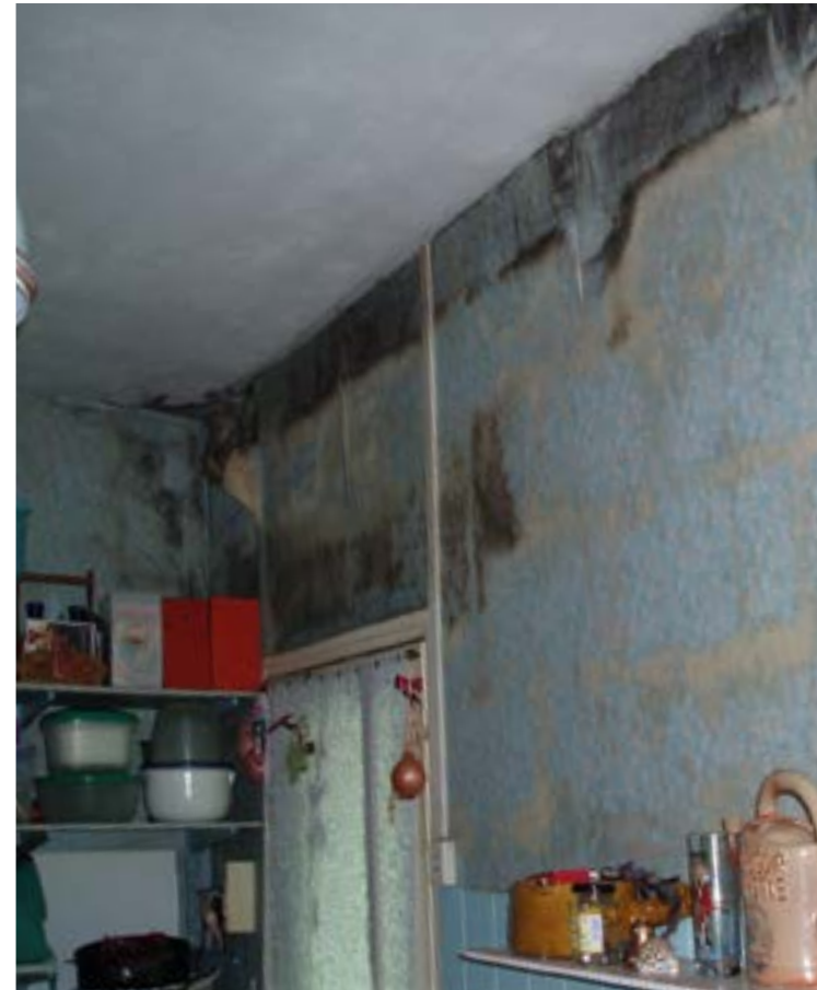
Depuis 2014, 126 logements insalubres ont été repérés et réhabilités après l'intervention de la Ville.

Le service de la Ville étend aussi sa mission à la lutte contre les rats ou les frelons asiatiques. S'il dératise les réseaux publics, il fournit aussi du raticide à la demande aux habitants confrontés à la présence de rongeurs. Tout comme la Ville participe à hauteur de 50 % à vos frais de destruction de nids de frelons asiatiques. Contacter le service Hygiène – Santé de Rochefort : 05 46 82 65 19 ou hygiene@ville-rochefort.fr