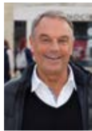
Gérard Pons Commerce, animations, travaux, domaine public

La traditionnelle patinoire de fin d'année revient s'installer sur la place Colbert. 1 100 m 2 de glace ouverts au public du 30 novembre au 12 janvier.