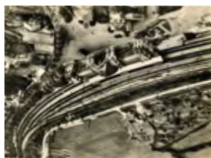
Vue aérienne de la gare, 3F14

TERMINUS ! TOUT LE MONDE DESCEND ! Jusqu'au 15 janvier 2024 Attention au départ, les Archives Rochefort Océan vous emmènent en voyage... Accès libre et gratuit