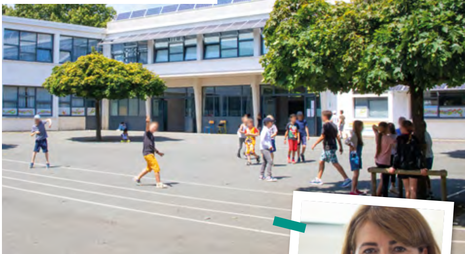
Sophie Cousty , Adjointe aux affaires scolaires et périscolaires et à la Petite Enfance

Si les travaux de l'école Herriot élémentaire ont débuté en juillet, ils se poursuivront jusqu'à la Toussaint. La Ville a investi 460 000 € dans la mise en accessibilité de l'établissement (installation d'un ascenseur), la réfection des sols et peintures du premier étage mais aussi pour la mise aux normes des offices de restauration qui, à elle seule, revient à 125 000 €. Un chantier qui n'avait pas touché à sa fin le jour de la rentrée mais les repas continuent d'être assemblés et servis au réfectoire sans aucun changement pour les élèves. Cet investissement à l'école Herriot élémentaire fait suite à celui de 2022. Rochefort avait alors consacré 195 000 € à la réhabilitation des sanitaires enfants et des vestiaires du personnel.