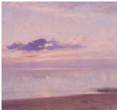
Un soir de novembre à Chatellaillon / Le calme (détail). Louis Auguin. Huile sur toile. 1885. Coll. Musée d'Art et d'Histoire de Rochefort, inv. 13