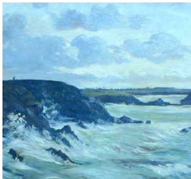
Grande Marée (détail). Alfred Mouillon. Huile sur toile. 1881. Coll. Musée d'Art et d'Histoire de Rochefort, inv. 140