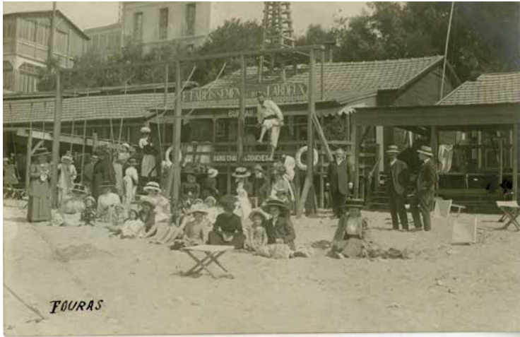
Structure de jeux et d'agrès sur la plage de Fouras, début XXe siècle. Carte postale, 200S186