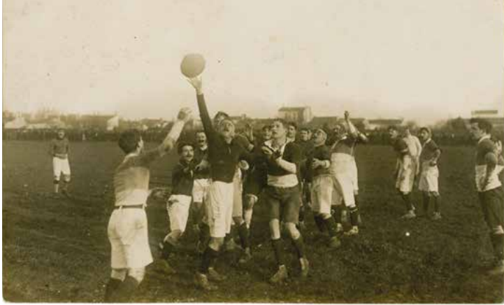
Le match Rochefort - Cognac le 28 janvier 1912 à Rochefort.