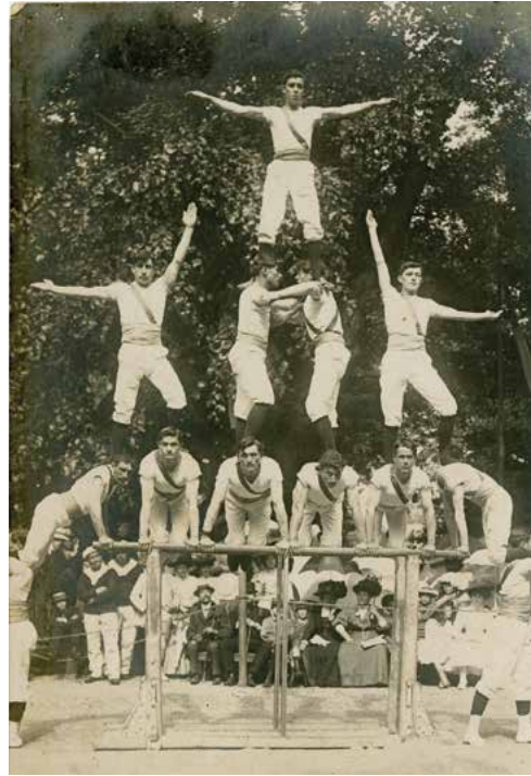
Pyramide humaine, en vogue lors des concours de gymnastique. Photo-carte, 200S166