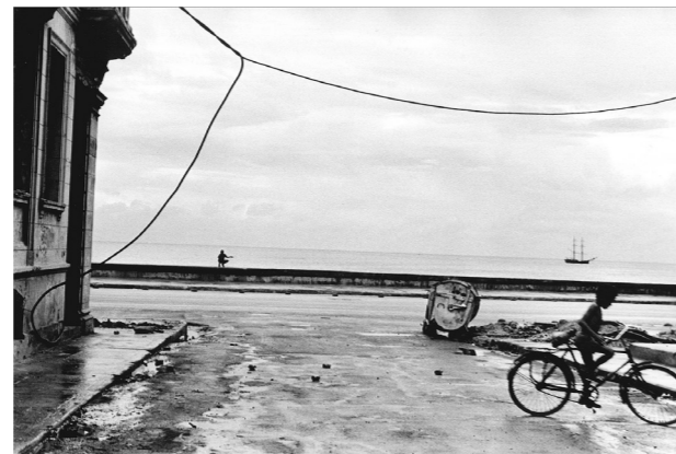
Cuba, La Havane, 1995