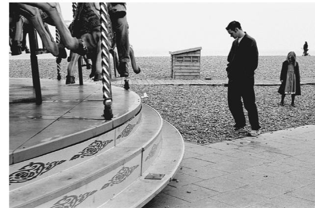
Grande-Bretagne, Brighton, 1998

La Médiathèque du patrimoine et de la photographie édite des monographies des photographes dont elle conserve les fonds.