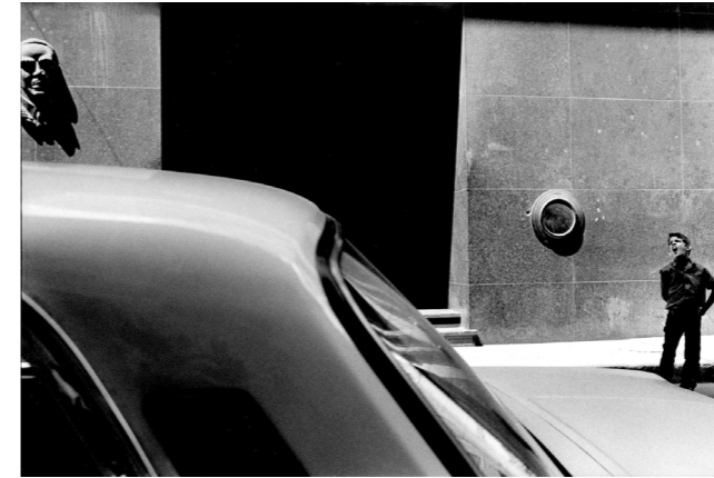
Cuba, La Havane, 1995

Toutes ces donations illustrent la force et la qualité du travail des institutions françaises vis-à-vis des photographes.