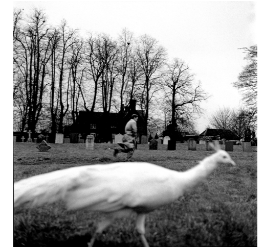
Grande-Bretagne, Wiltshire, 1993