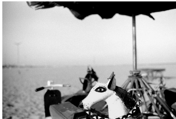
Inde, Madras, 1993