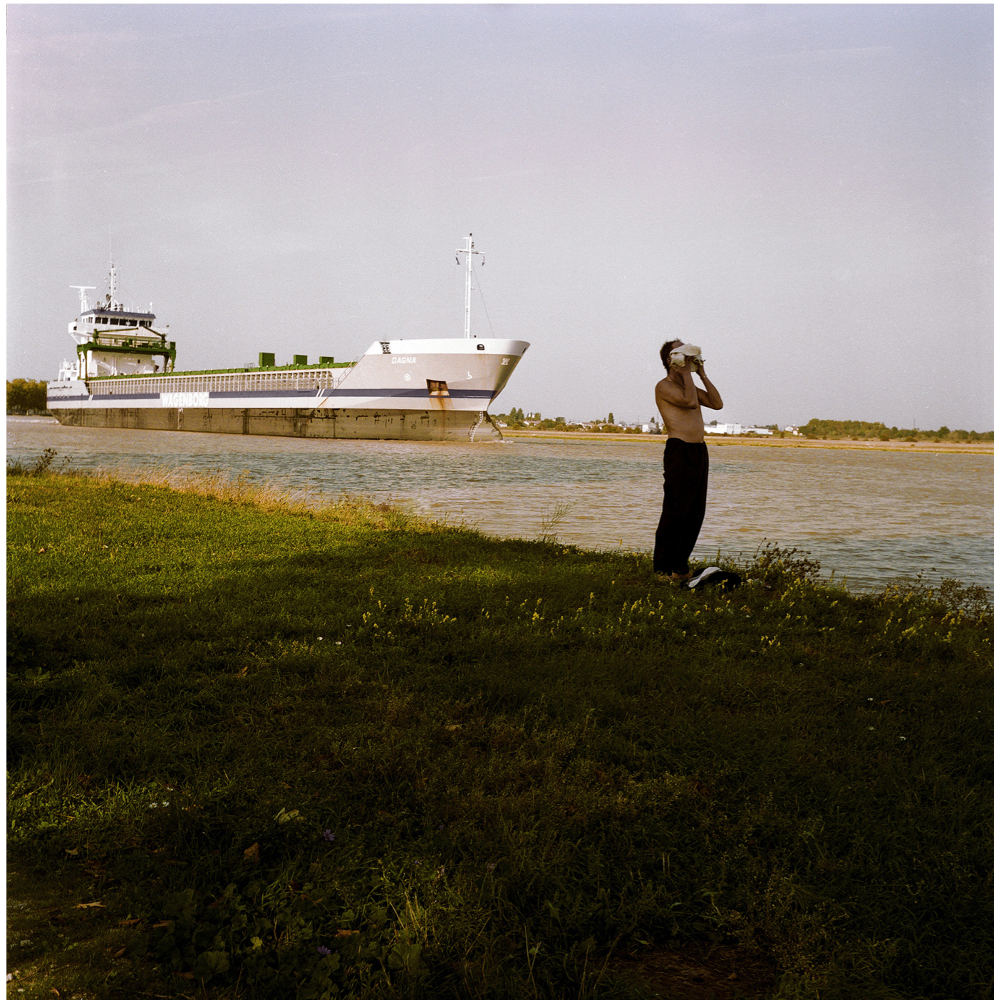
Rochefort, 2006