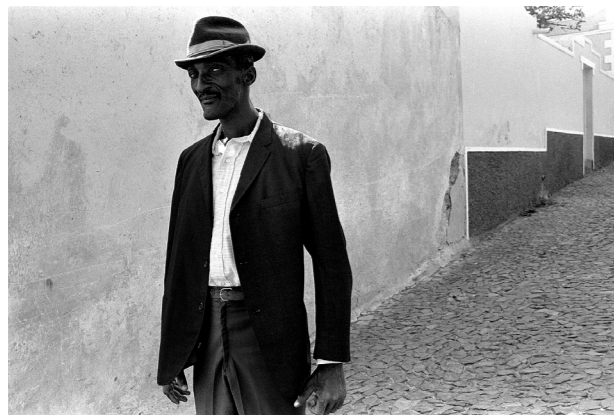
Cap-Vert, Fogo, 1986