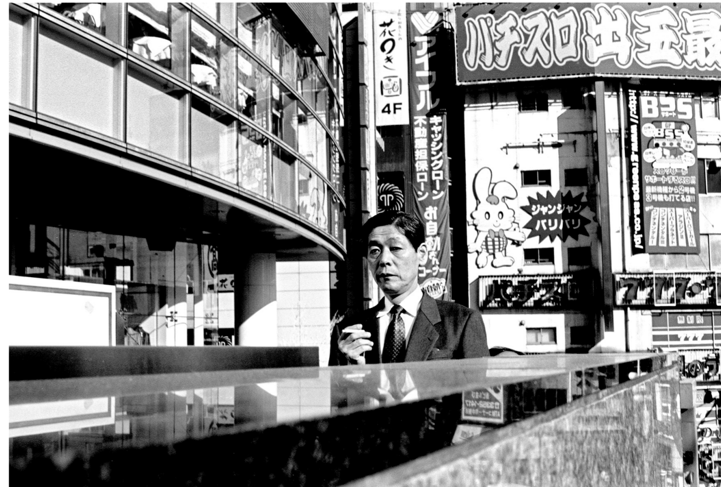
Japon, Tokyo, 2001