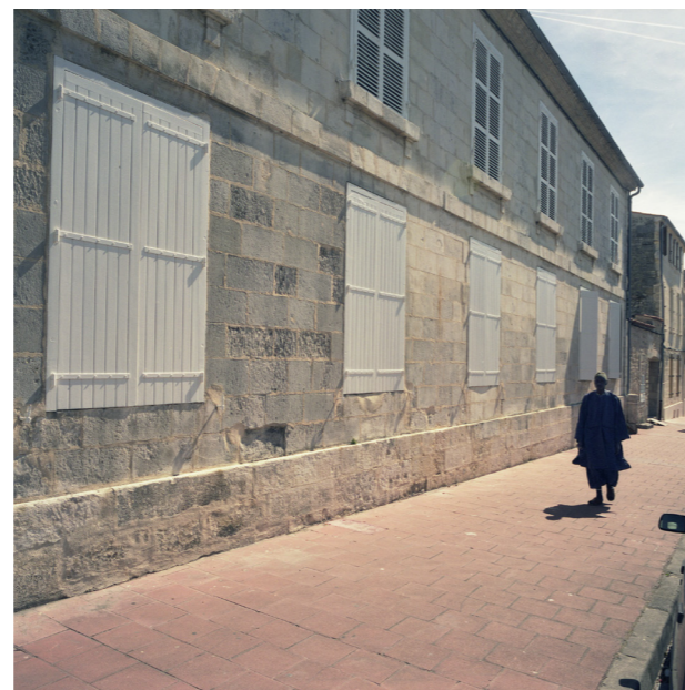
Rochefort, Le Spahi, 2006