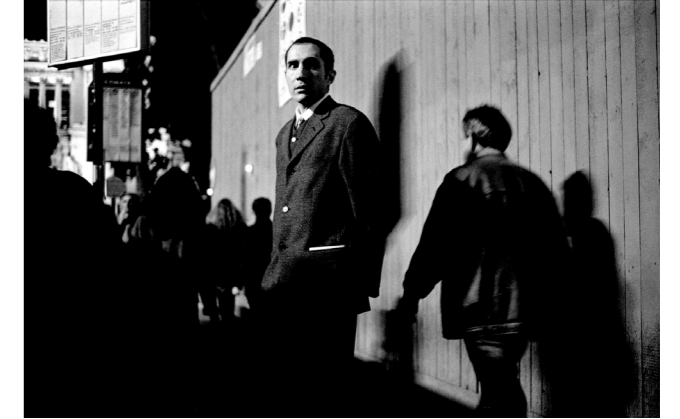
Italie, Rome, 1998