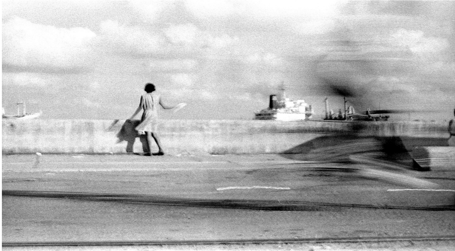
Cuba, La Havane, 1991