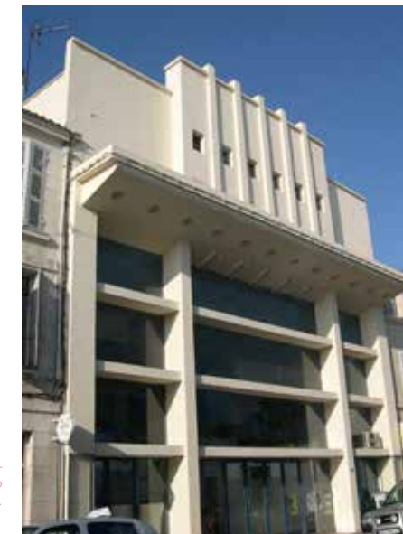
Aujourd'hui, le cinéma l'Alhambra-Colbert a laissé la place à un studio d'enregistrement.

Chaque soir l'équipe du film se retrouve autour de Jacques Demy dans ce cinéma pour visionner les rushes et imaginer le montage définitif du film. Ensuite les vedettes sont souvent conviées à des soirées organisées en leur honneur par le Ciné-club, l'Office de tourisme, la Base aérienne... Puis chacun rentre chez soi, à l'hôtel Le Continental, au Paris ou au Grand Bacha à Rochefort. Danielle darrieux, Catherine Deneuve et François Dorléac séjournent à Fouras.