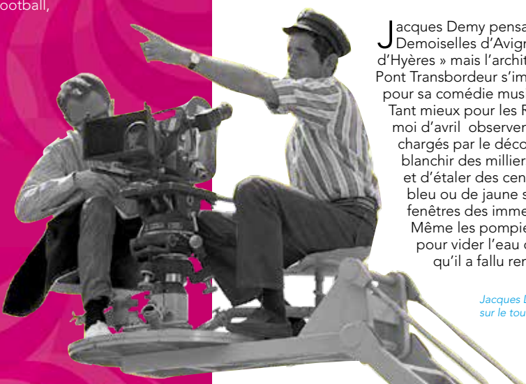
Jacques Demy sur le tournage