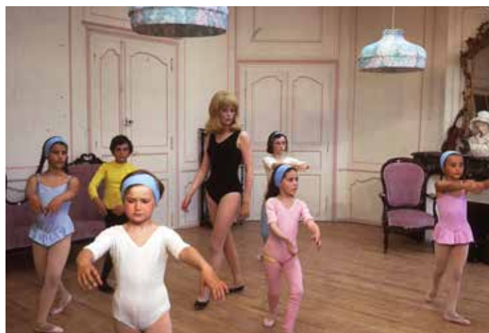
Catherine Deneuve et les enfants du Conservatoire de Musique

Mairie - Place Colbert Au premier étage, le bureau du maire, fenêtres ouvertes sur la place Colbert, est transformé en studio : c'est l'appartement des Demoiselles. De là, Delphine (Catherine Deneuve) et sa sœur Solange (Françoise Dorléac) ont une vue imprenable sur l'animation de la place Colbert.