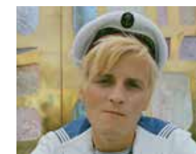
Maxence (Jacques Perrin), marin, peintre et poète