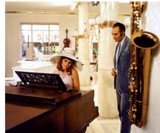
Solange (Françoise Dorléac) et Monsieur Dame (Michel Piccoli)

Les jours de mauvais temps, l'équipe en profite pour tourner les scènes d'intérieur du magasin de musique de Monsieur Dame (Michel Piccoli) aménagé dans un coin de la Bourse du commerce. Le bâtiment incendié en 1970 est reconstruit et désormais ce sont les poissonniers qui chantent pour attirer la clientèle les jours de marché.