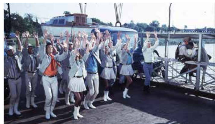
L'arrivée des forains par la nacelle du Pont Transbordeur

C'est ici, le mardi 31 mai 1966, à 9h00 précises, qu'a été donné le premier tour de manivelle. Le cortège des forains traverse la Charente sur la nacelle du Pont Transbordeur.