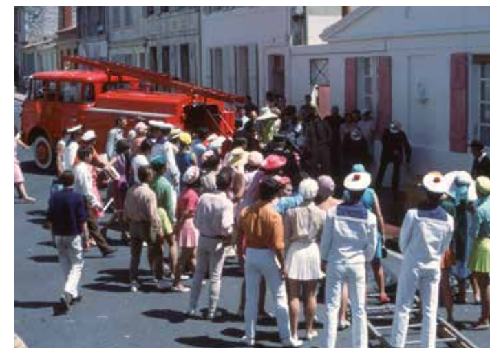
« Ne restez pas là, circulez, soyez chics. Nous ne voulons pas vous être antipathiques. Ne nous forcez pas à vous cogner dessus à bras raccourcis. »