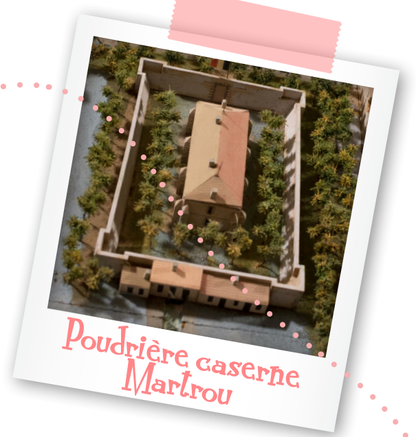
Poudrière caserne Martrou