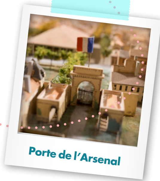
Porte de l'Arsenal