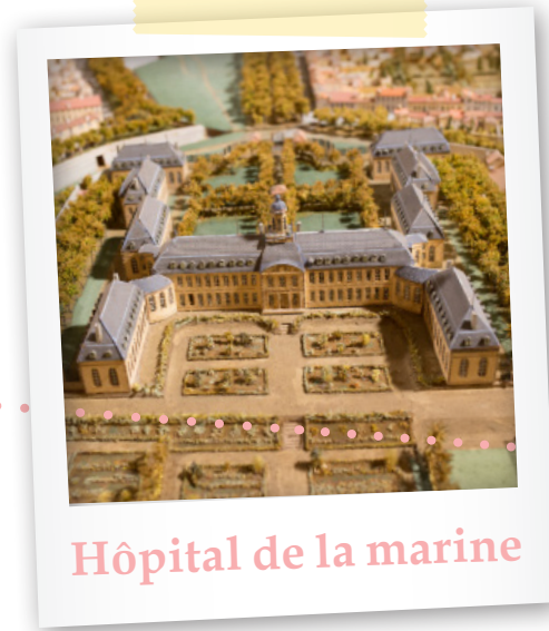
Hôpital de la marine